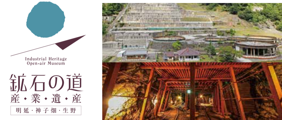
鉱石の道 産・業・遺・産 明延・神子畑・生野

生野から北へ24kmとつづく「鉱石の道」。風格ある日本最古の全鋼鉄製の橋を過ぎ、東洋一の規模を誇った神子畑選鉱場にたどり着きます。さらにその先は明延鉱山。総延長550kmにもおよぶ坑道から鉱石を運び出すトロッキ軌道をめぐらせ、地下1,000mの奥底へとつながっています。先端技術を取り入れた、レールがつくる「鉄の道」は、鉱山採掘に目覚ましい「スピード」をもたらしました。 神子畑と明延間には、鉱石と人を運んだ「明神電車」が走っていました。運賃が1円だったことから「1円電車」と親しまれ、今に姿を残しています。