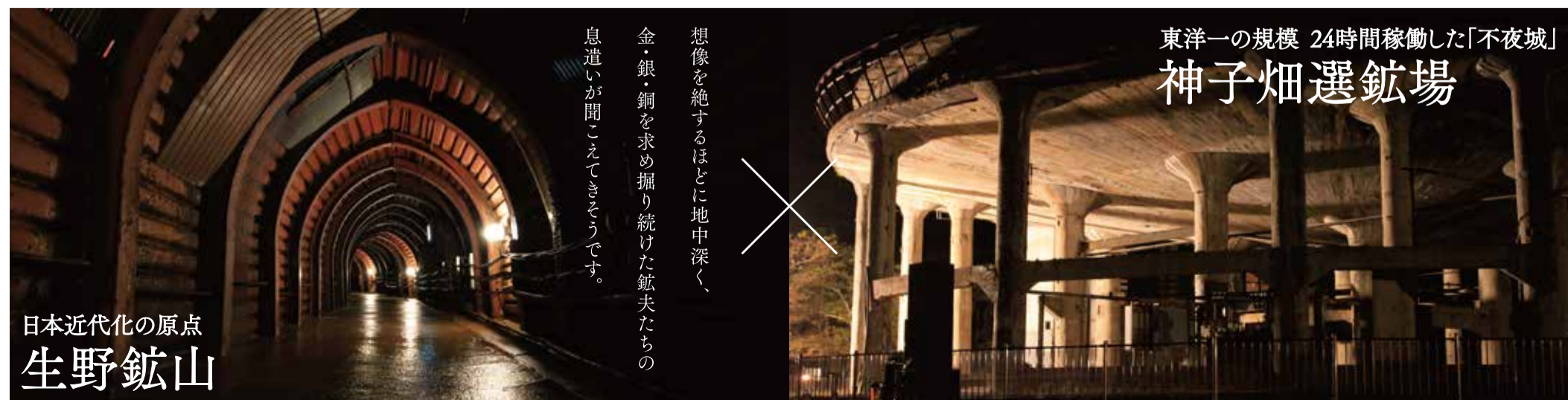
日本近代化の原点 生野鉱山

想像を絶するほどに地中深く、 金・銀・銅を求め掘り続けた鉱夫たちの 息遣いが聞こえてきそうです。