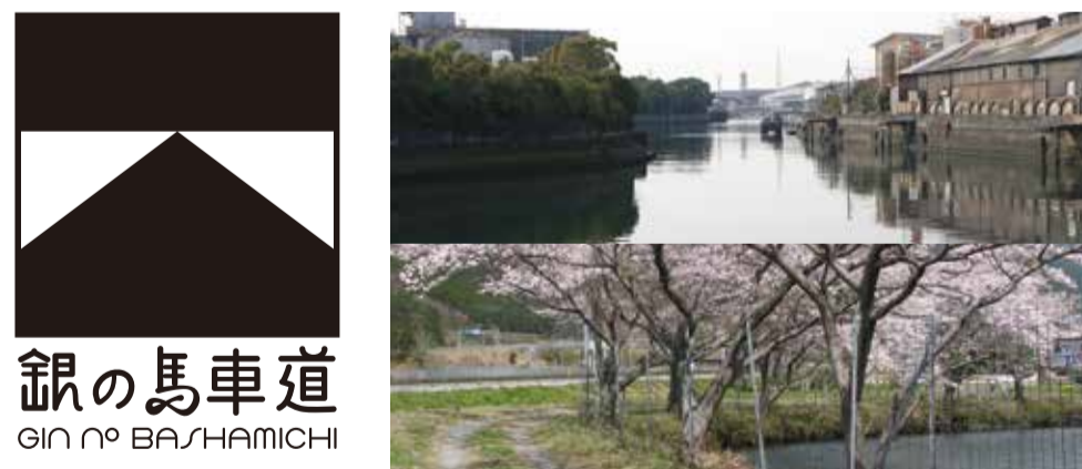
銀の馬車道 GIN NO BASHAMICHI

日本初の高速産業道路と言われる「銀の馬車道」は、明治9年播磨の飾磨港（現姫路港）と49km北の生野鉱山とを結ぶために造られました。道の起点となる飾磨港周辺には、生野産のレンガで作られた「飾磨津物揚場」跡があり、船で運ばれた機械や物資等を生野へ運ぶための道でした。建設ルートは最短・平坦を選び取り、重さに耐え得る画期的な構造を持った馬車専用道でした。前例もマニュアルもない、日本初の「舗装」された道をつくることはその当時、想像を絶する一大プロジェクトでした。